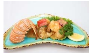
Sautéed lobster with light butter

* Price do not include applicable Hawaii State Tax & Gratuity 表示価格にはハワイ州税とチップは含まれておりません