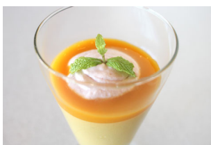
Soymilk Mango Pudding 豆乳マンゴープリン