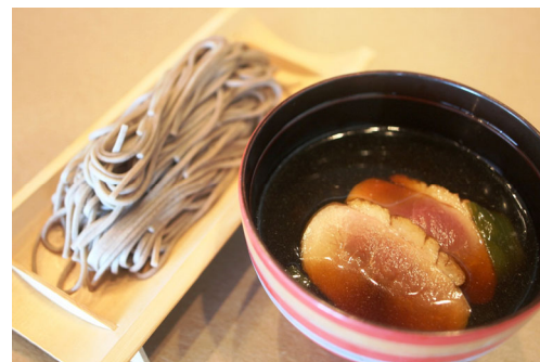
Hot Duck Soup-Cold Soba 鴨蕎麦