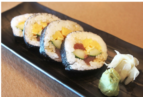
Big Rolled Sushi 太巻き寿司