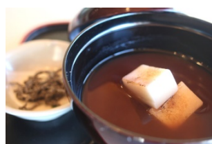
Sweet Red-Bean Soup お汁粉