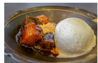
Japanese Wheat Gluten 半兵衛麩の黒蜜煮